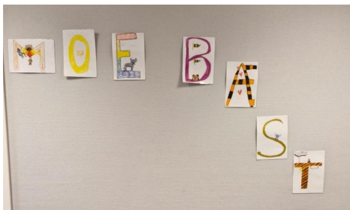
Ein stille "protest" henta frå skulegangen ved Mo oppvekstsenter

Kjære politikarar - de som bestemmer - ikkje legg ned skulen her ved Mo oppvekstsenter, for då blir vi og alle andre elevar her veldig lei oss.