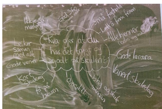
Tankekart 3. og 4. trinn

Vi er trygge her for ALLE KJENNER ALLE! Skuleområdet vårt er så lite at det er lett å finne fram. Vi møter alltid vaksne vi kjenner anten om dei arbeider i barnehagen eller på skulen.