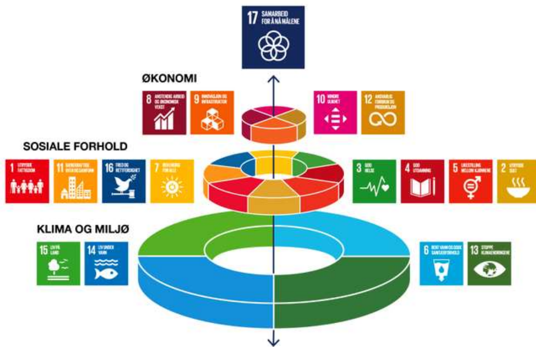
Illustrasjon frå FN- sambandet