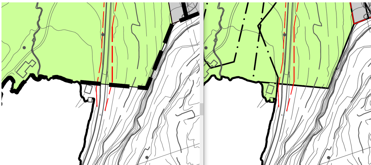
Bilde 2 Utviding av planområdet til omfatte naust i Svinvika. Nytt plankart til høgre